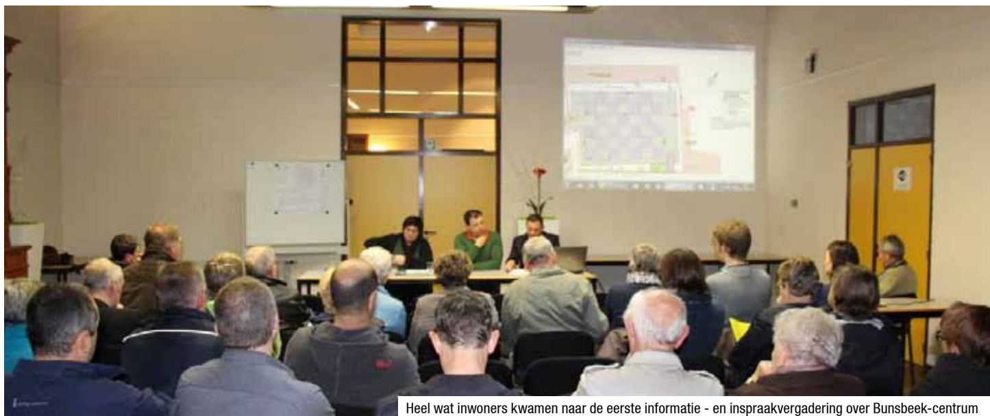
Heel wat inwoners kwamen naar de eerste informatie- en inspraakvergadering over Bunsbeek-centrum